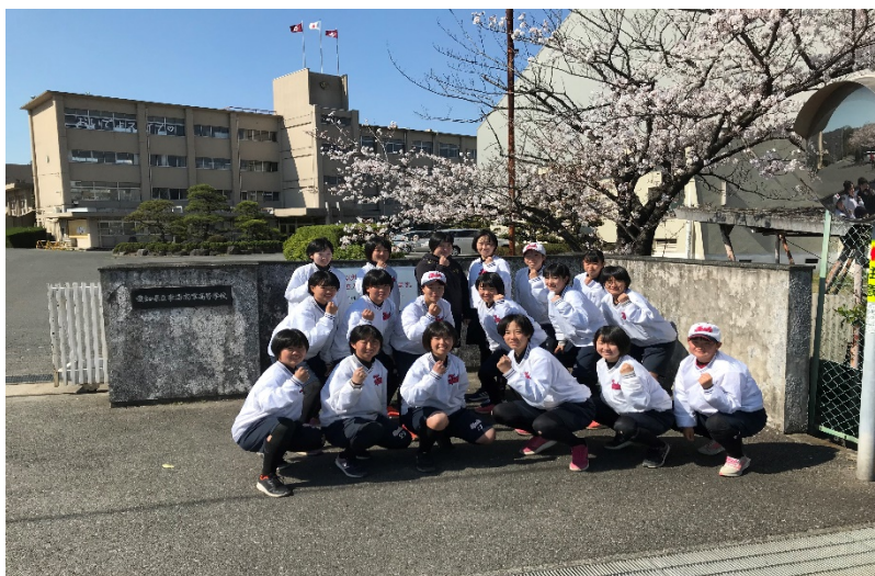
北門前の桜の下で